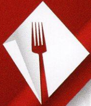
Planche à partager 17€